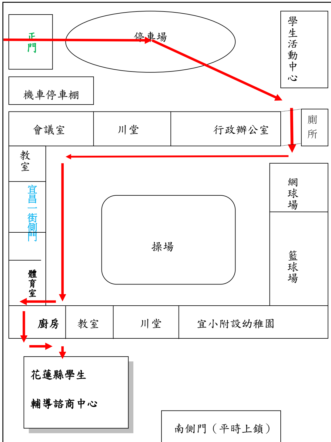
◎宜昌國小宜昌一街正門到花蓮縣學生輔導諮商中心平面圖

◎ 因假日門禁管制及教室整建工程，請由宜昌國小活動中心及行政辦公室間之通道進入校園，穿過操場，沿著廚房旁之通道至輔諮中心二樓辦公室報到。