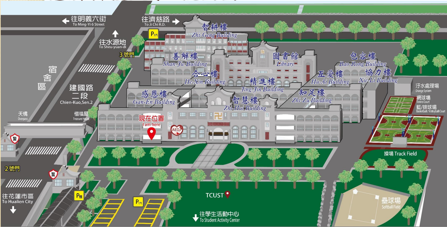
慈濟科技大學 校園導覽總圖 TCUST CAMPUS MAP