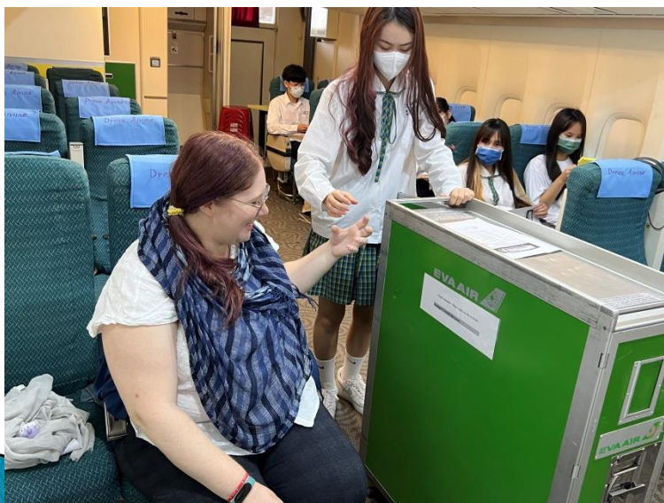
觀光英語課程（應用英語科）