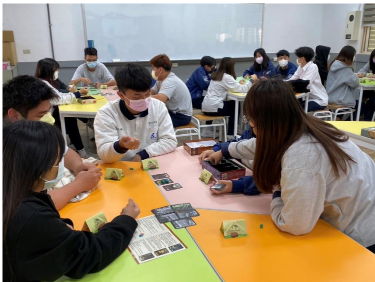
理財教育課程（會計科）