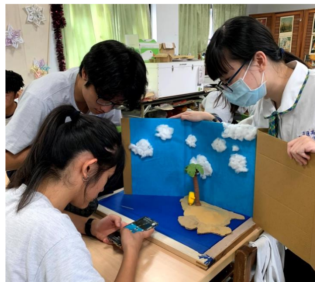
逐格動畫製作課（多媒體設計科）