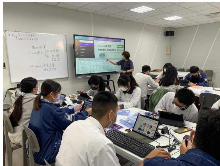
物聯網課程（資料處理科）